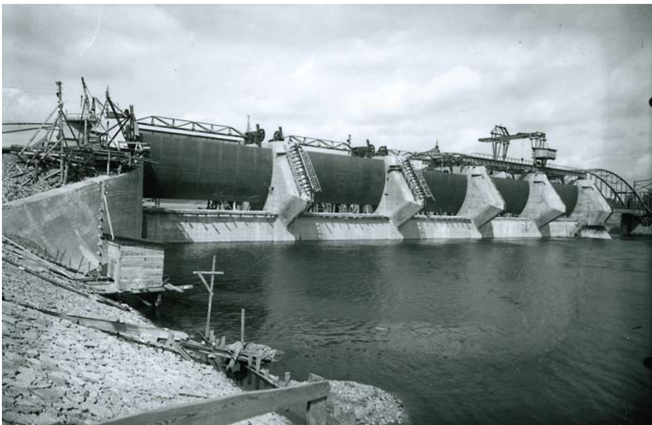
Foto: Eduards Kraucs 1939. gada 20. aprīlī. No Latveņģo koncerna Enerģētikas muzeja krājuma

Ķeguma HES – Latvijas Republikas brīvvalsts pirmā perioda tautsaimniecības simbols.