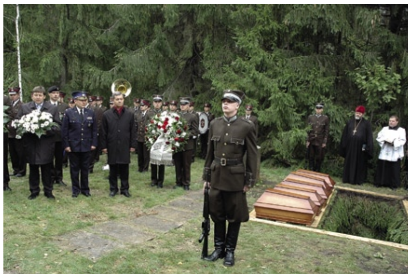
Ziemassvētku kaujās kritušo karavīru pārapbedīšanas ceremonija 2007. gadā