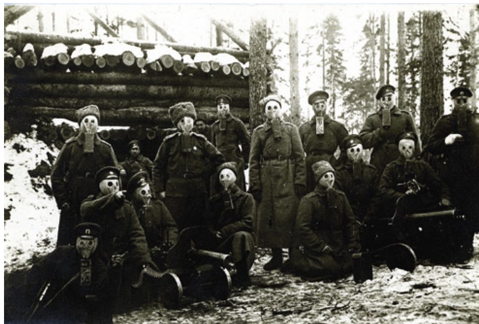
Latviešu strēlnieki Ziemassvētku kauju laikā