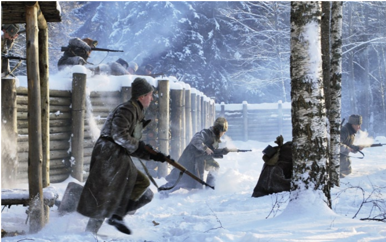
Pirmā pasaules kara kaujas rekonstrukcija Ziemassvētku kauju muzejā 2009. gadā