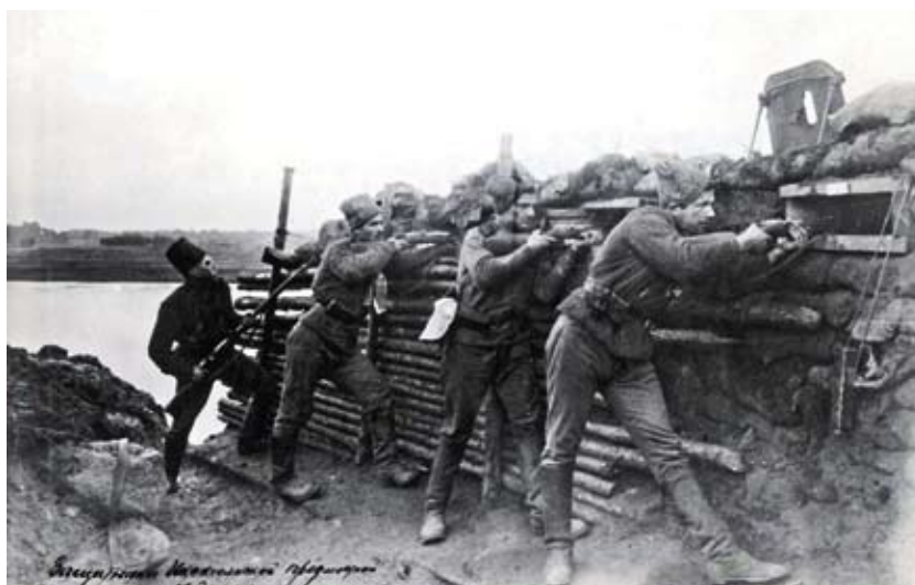
Krievijas Valsts Kara vēstures arhīva fonds